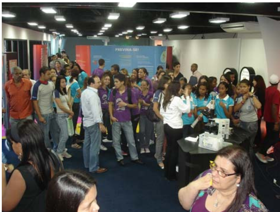
Espaço de convivência

O Museu conta com um Espaço de convivência para que o público possa frequentar seu interior sem necessariamente visitar as exposições. Neste espaço o visitante terá à sua disposição uma livraria, cybercafé e duas lojas; deste local o visitante terá acesso ao auditório e ao planetário.