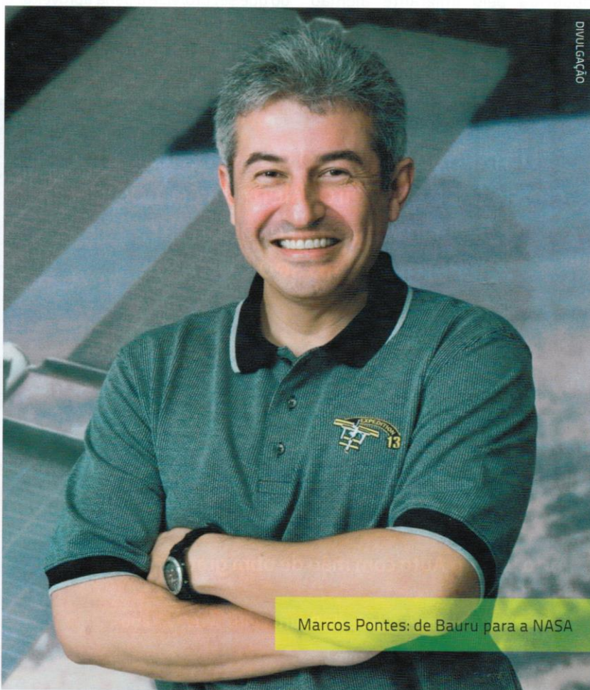
Marcos Pontes: de Bauru para a NASA

Mas quando perguntado sobre sua cidade natal, dá para sentir a delicadeza e o carinho por suas raízes, tão fortes quanto sua obstinação: "eu faço questão de expressar o meu amor pela nossa querida cidade de Bauru em todos os lugares que vou, seja na superfície desse planeta, ou fora dele", finaliza.